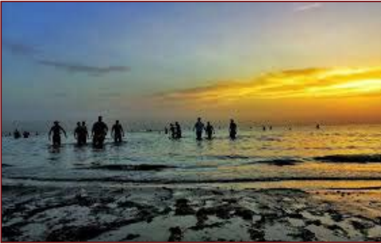
مدينة الحبانية السياحية

نعود إلى العصر الحديث مع الشاعر سركون بولص وهو شاعر عراقي مسيحي من مدينة الحبانية السياحية التي تقع وسط العراق.